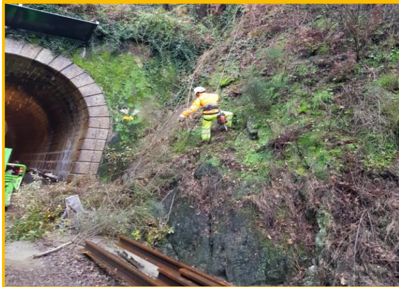
Início dos trabalhos