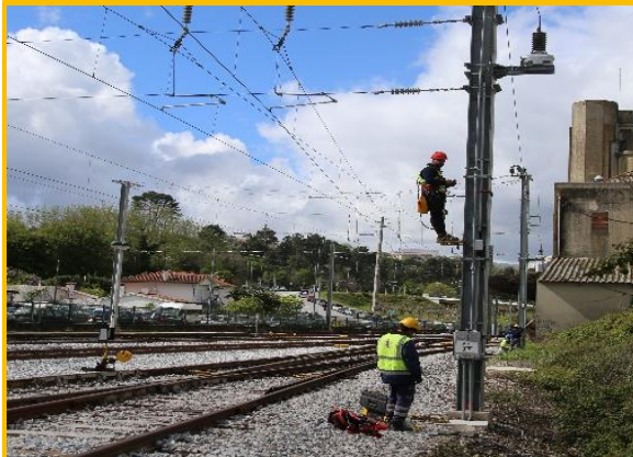
Durante os trabalhos