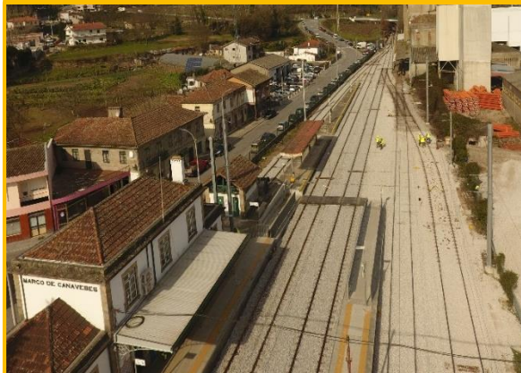
Início dos trabalhos