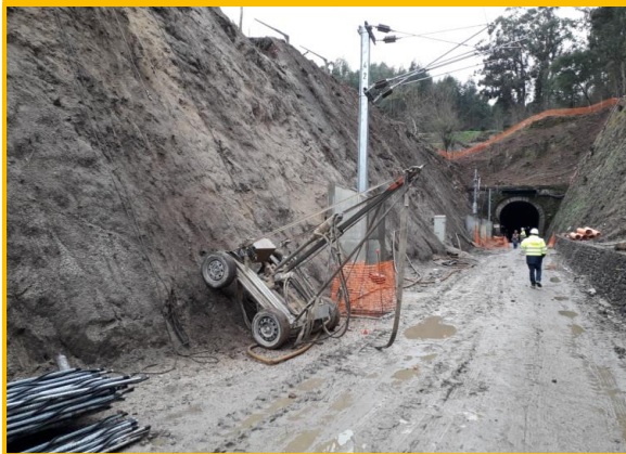
Durante os trabalhos