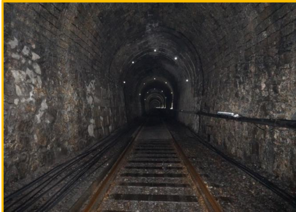
Início dos trabalhos