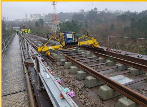
Durante os trabalhos