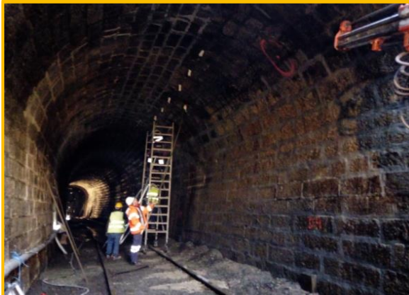
Durante os trabalhos