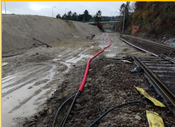
Durante os trabalhos