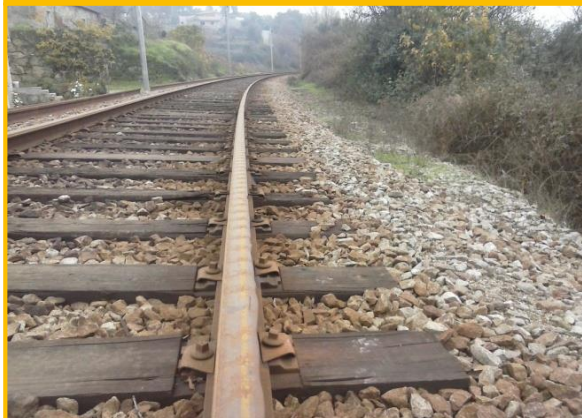
Início dos trabalhos