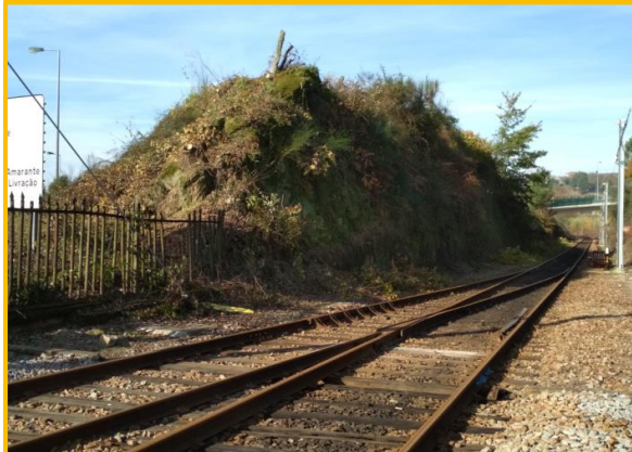
Início dos trabalhos